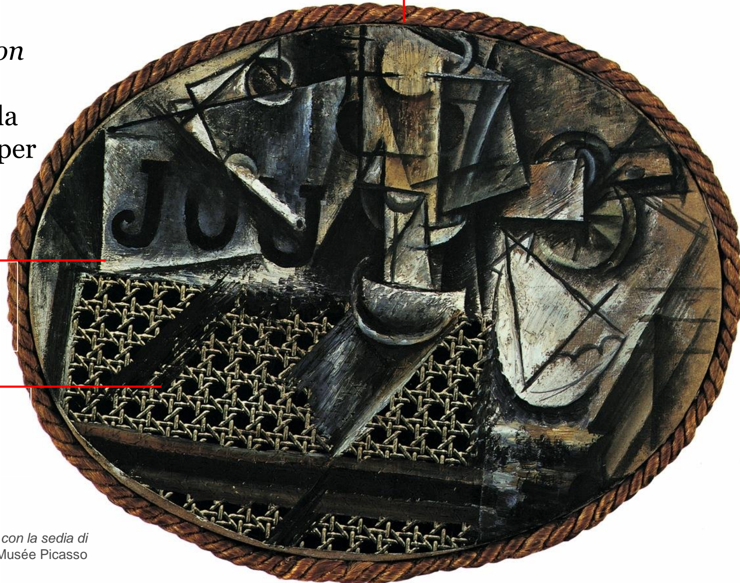
Pablo Picasso, Natura morta con la sedia di paglia , 1912. Parigi, Musée Picasso