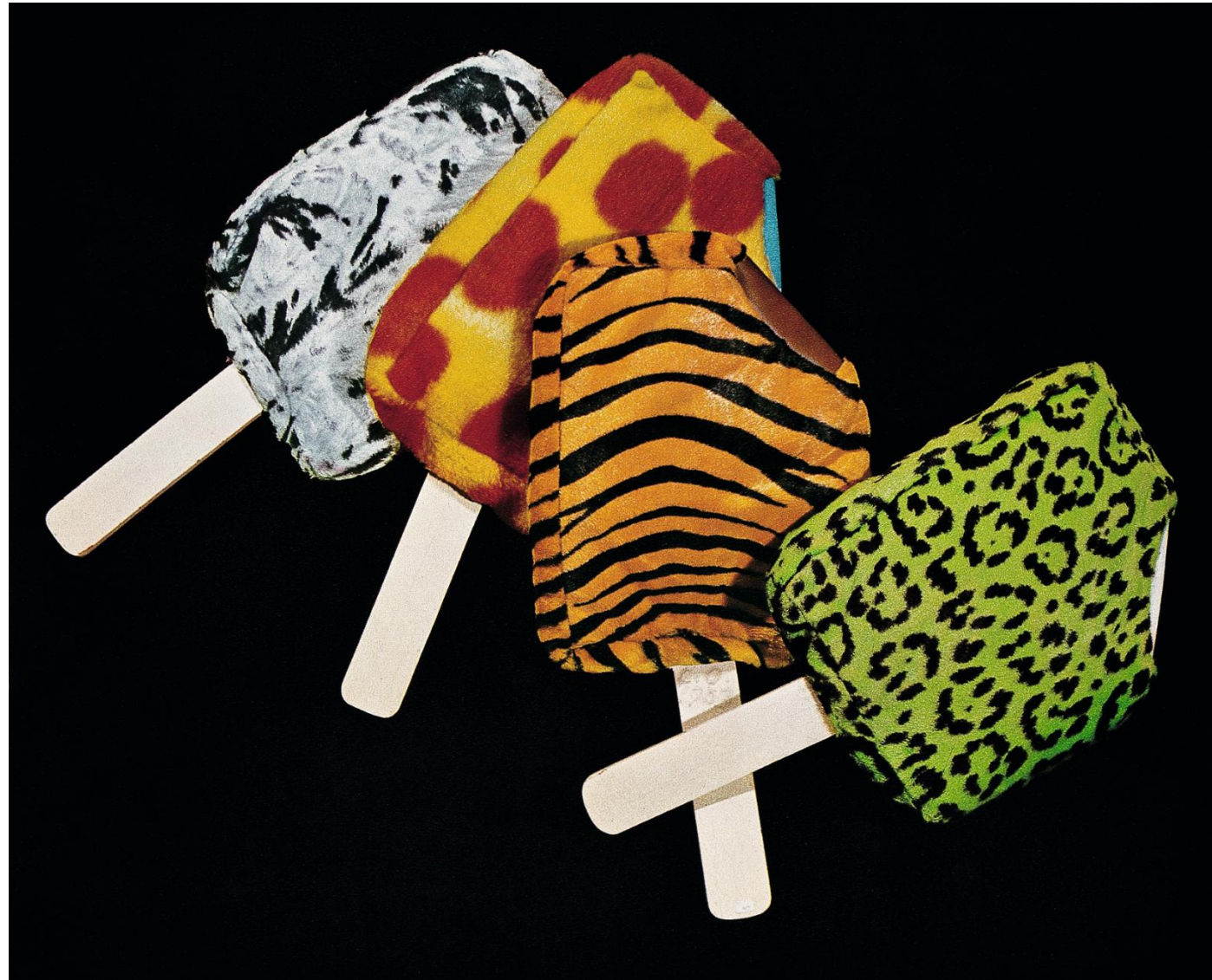
Claes Oldenburg, Gelati da passeggio in morbido pelo , 1963. Collezione privata

La produzione artistica adotta le stesse tecniche usate per realizzare i prodotti di consumo: serigrafia, fumetto, calchi.