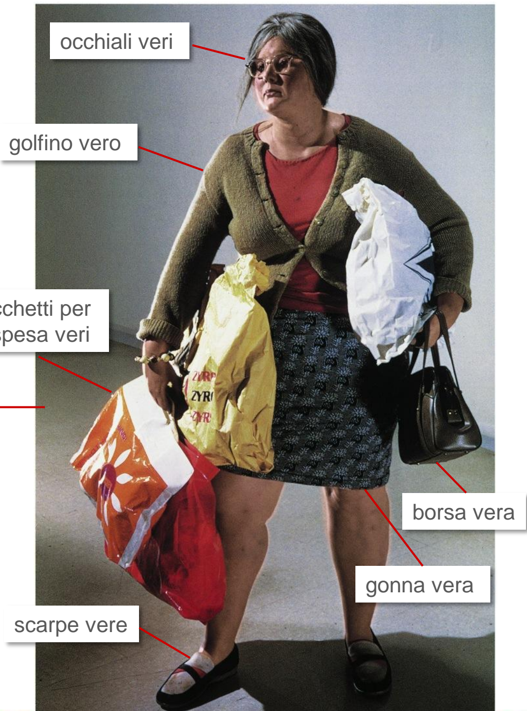
Duane Hanson, Giovane donna con le borse per la spesa , 1973. Collezione privata

l'esatto colore della pelle, i capelli finti, gli abiti e gli oggetti reali, fanno assomigliare la statua a una persona vera, creando disorientamento in chi la guarda