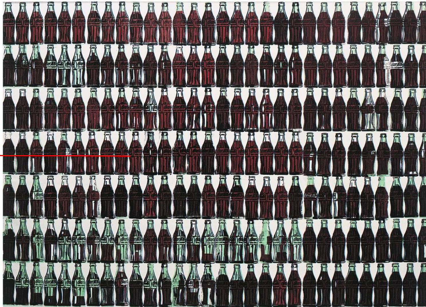
Andy Warhol, Bottiglie verdi di Coca-Cola , 1962. Zurigo, Ammann Fine Art

Andy Warhol raffigura grandi quantità di prodotti , tutti ossessivamente uguali , come si vendono negli scaffali dei supermercati