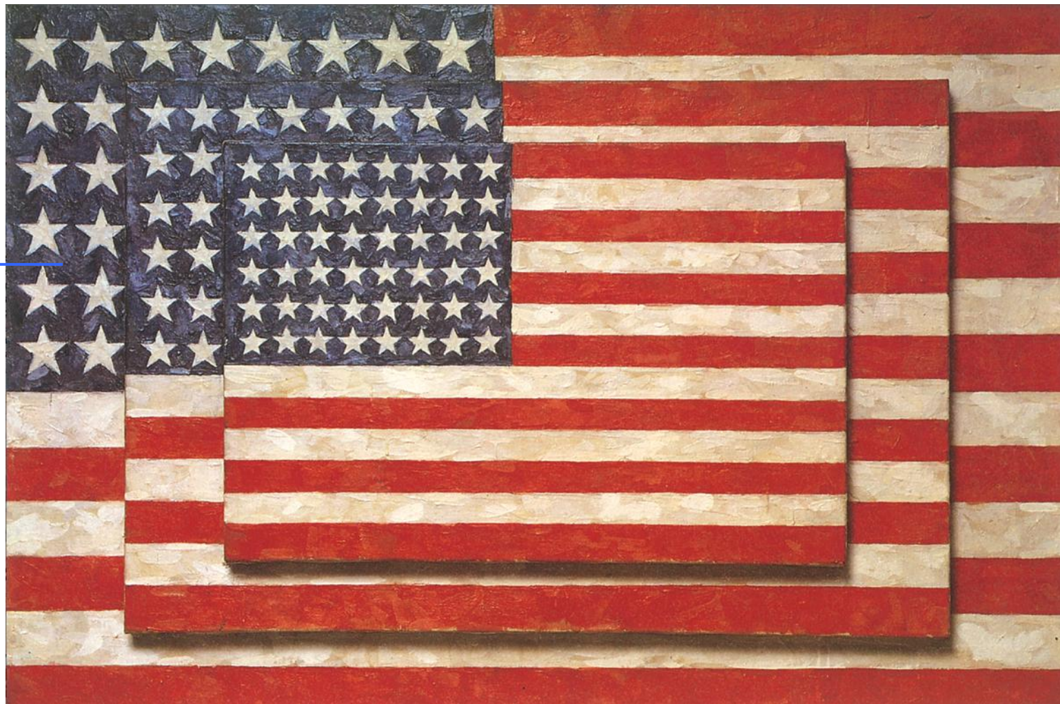
Jasper Johns, Tre Bandiere , 1958. New York, Whitney Museum

I soggetti sono cose reali e popolari , come la bandiera degli Stati Uniti