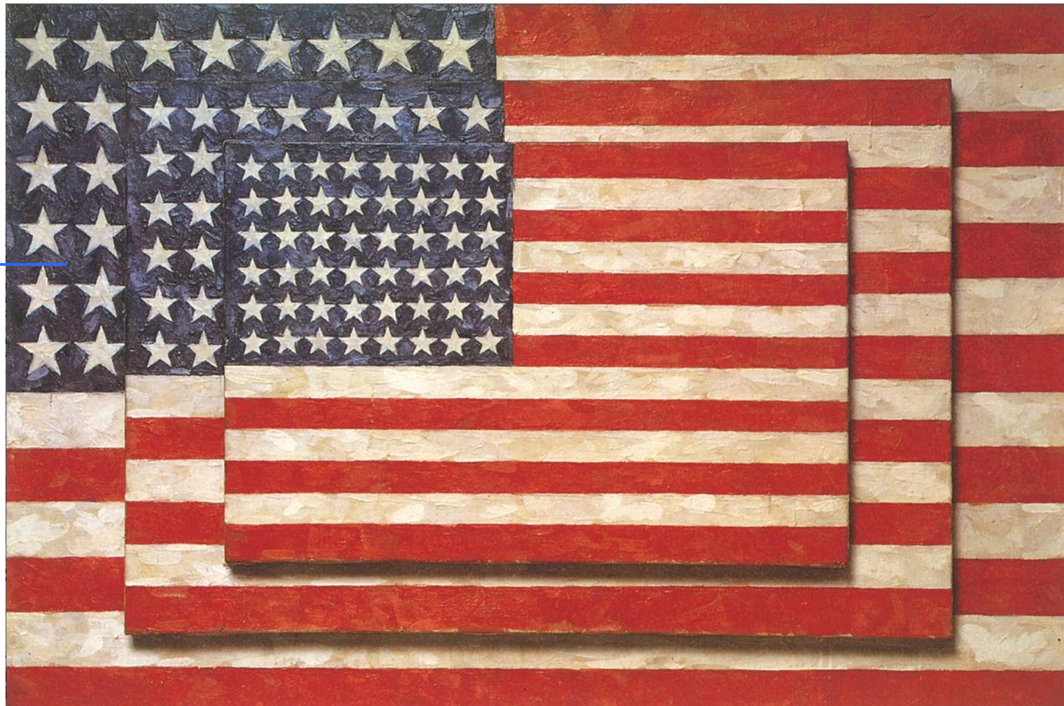
Jasper Johns, Tre Bandiere , 1958. New York, Whitney Museum

le bandiere di diverse misure, danno il senso della diffusione del soggetto